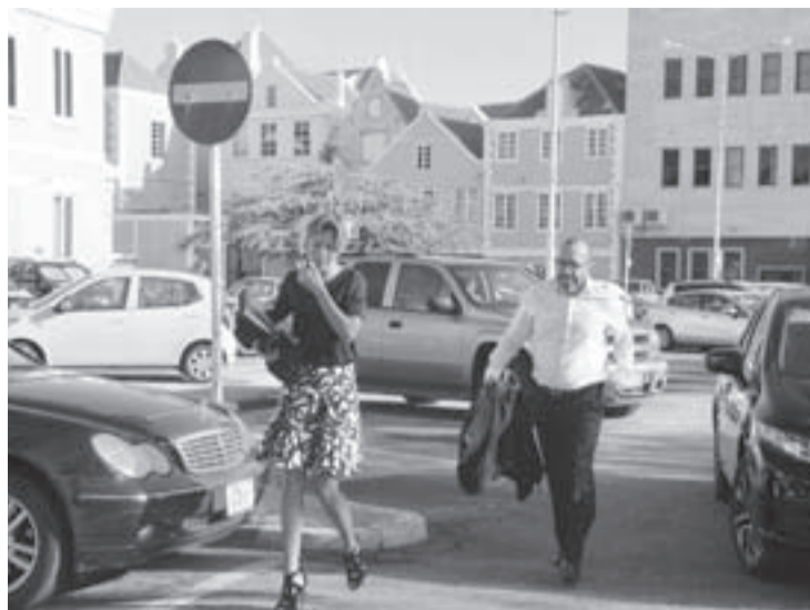
sabel pa su paspoort. Corte ta haya cu como ambtenaar, Gerrit Schotte a laga su mes wordo cumpra pa regalonan

Tambe Hues ta haya proba, cu Gerrit Schotte no a papia berdad relaciona cu su paspoort diplomatico. Corte ta indica, cu e persona mes ta respon-